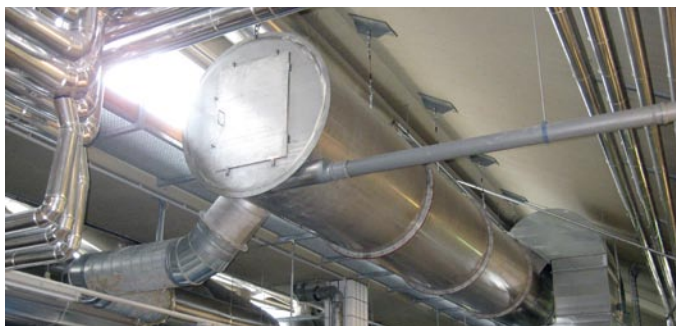
In der Wäscherei des Krankenhauses in Steyr fand der neue Abluftwärmetauscher von Fercher aufgehängt an der Hallendecke seinen Platz.

Für kleine bis große Wäschereien hat Fercher mit Sitz in Graz, Österreich, seine Abluft- und Abwasserwärmetauscher konzipiert. Schon seit längerer Zeit läuft eines dieser Systeme in der Wäscherei des Krankenhauses in Steyr. Dort werden bei normalen Betrieb mit den Fercher-Wärmetauschern je nach Wäschereiauslastung täglich rund 150 bis 200m 3 Heizgas eingespart. „Unser Ziel war es, den größtmöglichen Betrag an Wärmeenergie effektiv zurückzugewinnen und dem Waschprozess wieder zuzuführen“, erläutert Dipl.-Ing. Josef Fercher. Deswegen beschränkte man sich nicht nur auf das Abwasser als potentielle Energiequelle, sondern ging noch einen Schritt weiter und installierte mit dem Fercher-Energiesprüh-tunnel Typ EST einen wartungsfreien Luft-